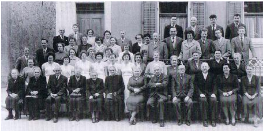
50 Jahre Samariterverein Gäu