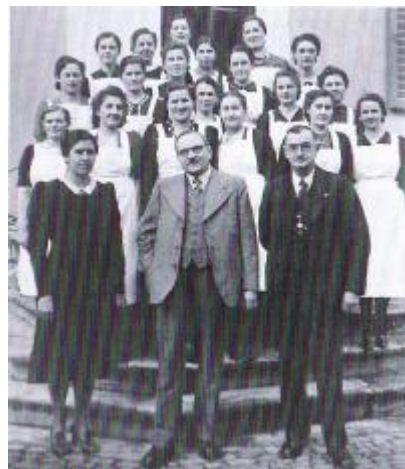
Samariterkurs rund um 1940

In den Kriegsjahren reduzierter Vereinsbetrieb.