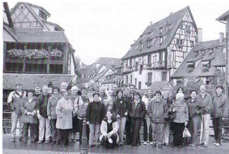
Vereinsreise 2004 ins Elsass