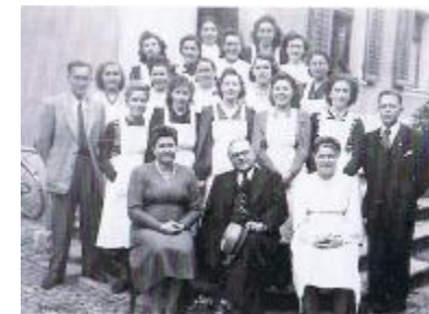
Samariterkurs im Jahre 1948