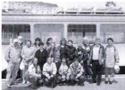
Vereinsreise 2008 auf die Rigi

Unter: www.samariter-gaeu.ch sind wir zu finden.