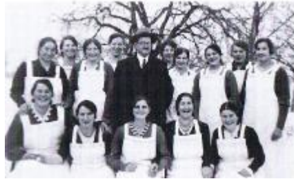
Samariterkurs um 1915

1. August 1914: Der Erste Weltkrieg bricht aus. Bei kriegerischen Ereignissen, die auch die Schweiz betreffen könnten, erhält das Samariterwesen eine ganz besondere Bedeutung. Es könnte auch der Fall eintreffen, dass sich die Mitglieder dem Schweiz. Roten Kreuz zur Verfügung stellen müssen. Am 23. August wird eine Feldübung durchgeführt. Die Annahme: Ein kriegerisches Ereignis. Da «infolge des Krieges» mehrere Gemeinden mit Truppen belegt sind, hat das Comité beschlossen, den vorgesehenen Samariterkurs nicht durchzuführen. Es wird angeregt, den Soldaten die Wäsche zu besorgen. Allfällige Kosten für Seife usw. seien aus der Vereinskasse zu begleichen.