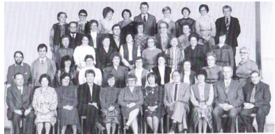
1983 – 75 Jahr-Jubiläum