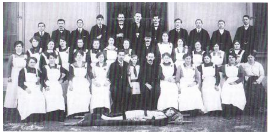
Der Verein 1915/1916

In zwanglosen Gruppen marschierten wir nun gegen die Steingrube, neugierig, welche Überraschung unser harter. Supposition war folgende: Knaben spielten unterhalb der Steingruppe und machten dort ein Feuer. Indem es ihnen dort zu langweilig wurde, kletterten einige von ihnen die Steingrube hinauf und kamen oberhalb derselben auf einem kleinen Vorsprung zu stehen. Dieser war der zu grossen Belastung nicht gewachsen, stürzte hinunter und die unvorsichtigen Knaben wurden nun teils vom nachstürzenden Geröll verschüttet, zwei davon rollten weiter hinunter in das Feuer. Wir mussten nun die Verwundeten zuerst an eine geschützte Stelle bringen, was nicht ohne teilweise schwierigen Transport geschah, bevor wir ihnen die Erste Hilfe angedeihen lassen konnten. Die Arbeit fiel befriedigend aus, trotzdem uns die Sonne fas zu Bratäpfeln schmorte. Nach der Übung gab's noch einen gemütlichen Hock im Hammer».