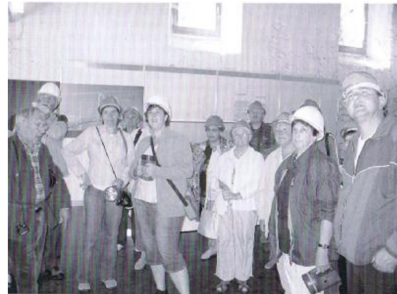
Vereinsreise 2006: Asphaltmine im Val de Travers

Wir haben in den letzten Jahren einige junge Leute in unseren Verein aufnehmen dürfen.